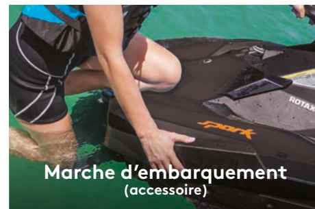
Marche d'embarquement (accessoire)

Conçu pour renforcer la liberté de mouvement lors de la conduite.