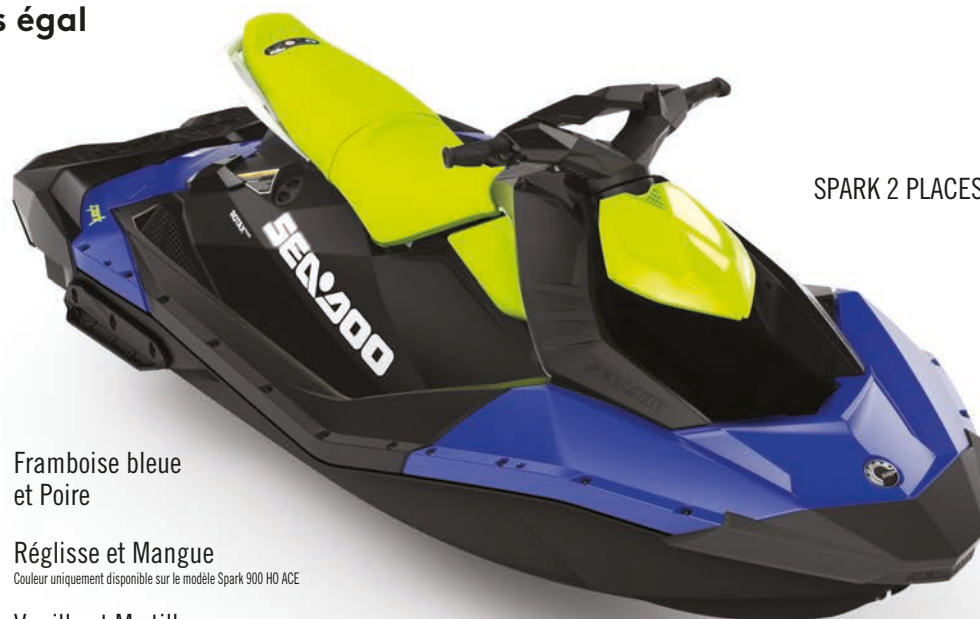
SPARK 2 PLACES