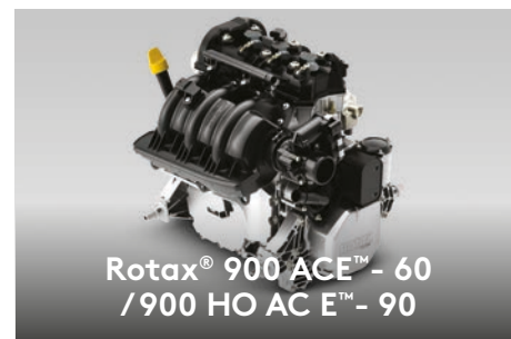
Rotax® 900 ACE™ - 60 / 900 HO AC E™ - 90

Ce plastique composite innovant est robuste et résiste mieux aux éraflures que la fibre de verre. En outre, le gain de poids aide à fournir des performances et un rendement impressionnants.