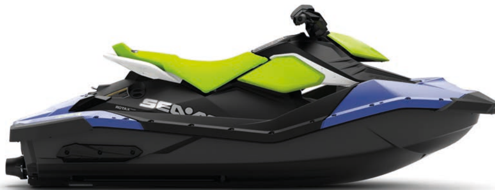
SPARK 2 PLACES