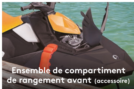
Ensemble de compartiment de rangement avant (accessoire)

Deux options de moteurs Rotax® économes en carburant, compacts et légers.